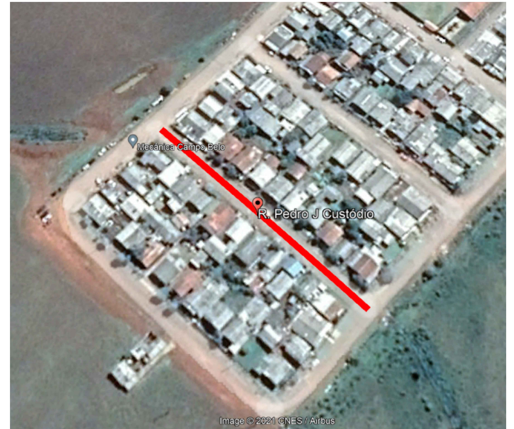
LOCALIZAÇÃO DA RUA

DISTÂNCIA ATÉ A DISTRIBUIDORA DE MATERIAL PÉTRIO - 49,6KM