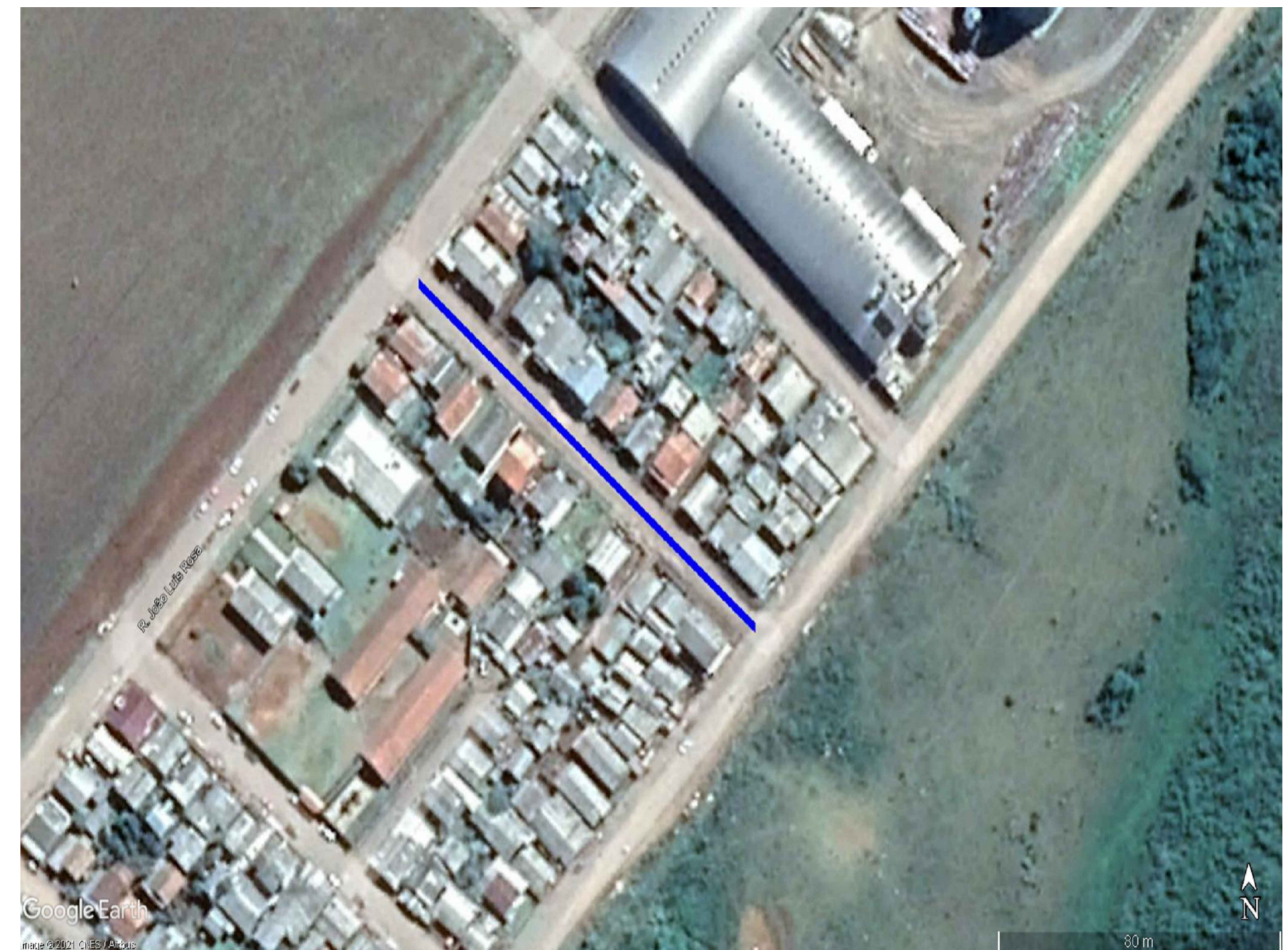
LOCALIZAÇÃO DA RUA