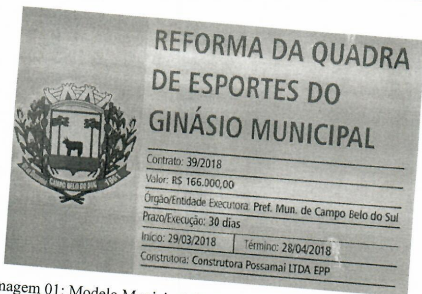
Imagem 01: Modelo Municipal de Placa de Obra (1,25 m x 0,80 m)

A placa deve ser fabricada com dimensão total de 1,00 m 2 , e deve seguir o seguinte modelo do município, sendo utilizados os dados que constarem no contrato assinado pela contratada: